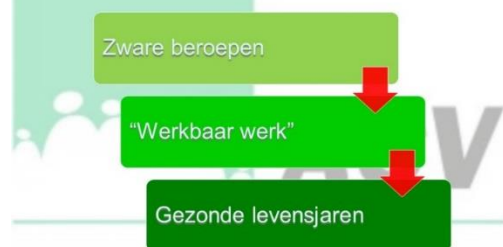
NPC - Problematiek zware beroepen in de openbare sector

We stellen echter vast dat er geen afdoende aanpak is op dit punt. Meer nog, de